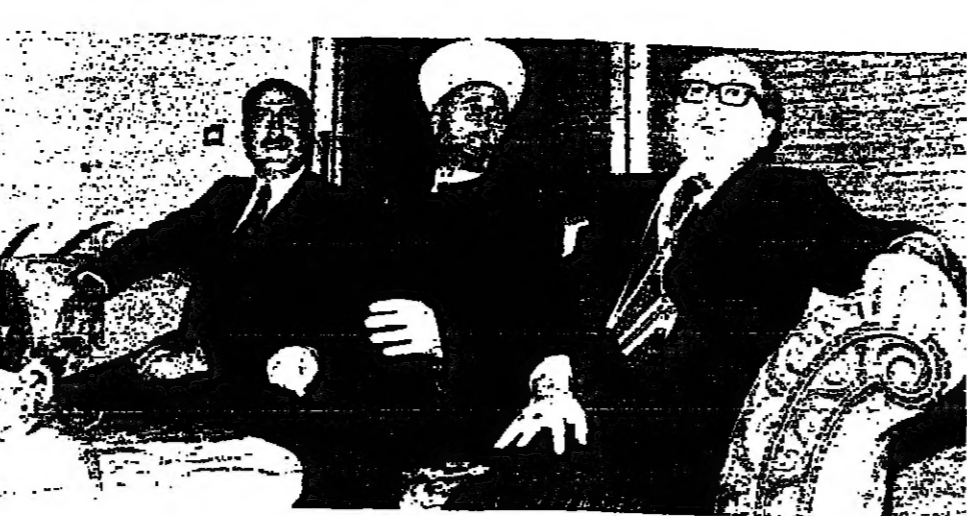
وزيرة سماحة المفتي حسن خالد، وبيد الوزير جمال ساسين